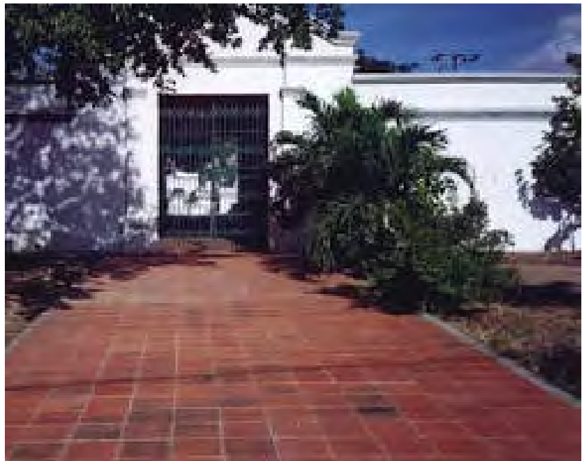
Cemitério judaico de Coro

Fomos criados e crescemos cercados por estereótipos sociais negativos em relação ao judeu, como observaremos abaixo, associados à “negritude” e ao mal. Lembro que, quando eu era criança, as marchas públicas católicas chamadas procissões, realizadas na Semana Santa pelas ruas da minha cidade natal, evocavam a Via Sacra e, entre seus figurantes, destacavam-se homens encapuzados vestidos inteiramente de preto, representando aqueles que haviam votado pela morte crucificação de nosso Senhor Jesus Cristo. Essa representação do judeu como equivalente ao mal e à traição me acompanharia desde então até o presente, quando pude ver o quanto há manipulação histórica e cultural nessas representações escolares aparentemente ingênuas.